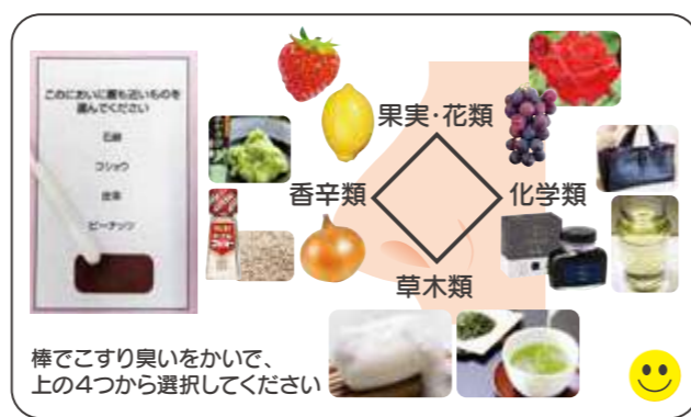
図1 ポケット嗅覚識別テスト 香りの分類

図2の左に示しますように、レビー小体型認知症では、6割の人が、果実・花類と香辛類の区別ができないようです。一方、アルツハイマー型認知症の人は(図2の右)、同じ果実・花類の中での識別が困難なようです。